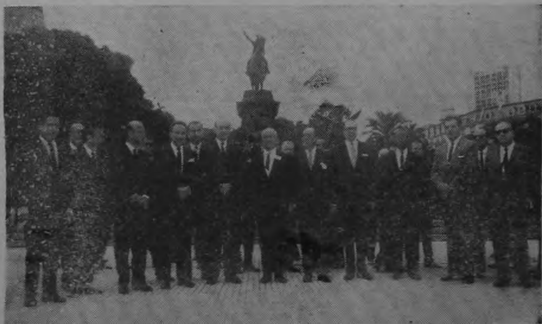
Los Cancilleres americanos que participan en la Tercera Conferencia Interamericana Extraordinaria y la Undécima Reunión de Consulta de Ministros de Relaciones Exteriores Americanas, que se

Uno de los llegados dijo que Cantón era "una ciudad en estado de confusión". Otros diarios publicaron informaciones similares, basadas en declaraciones de personas que llegan de Cantón.