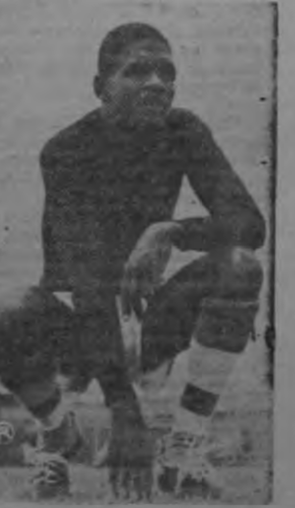
Por ahí se asegura también que Wanchope tiene ofertas muy interesantes. Si las cosas siguen por ese camino Limón parece que desintegrará su equipo.

Los limonenses verán debilitarse mucho su cuadro titular ya que se les fue el volante Roel Crawford para los Estados Unidos y ahora pierden a su arquero estrella.