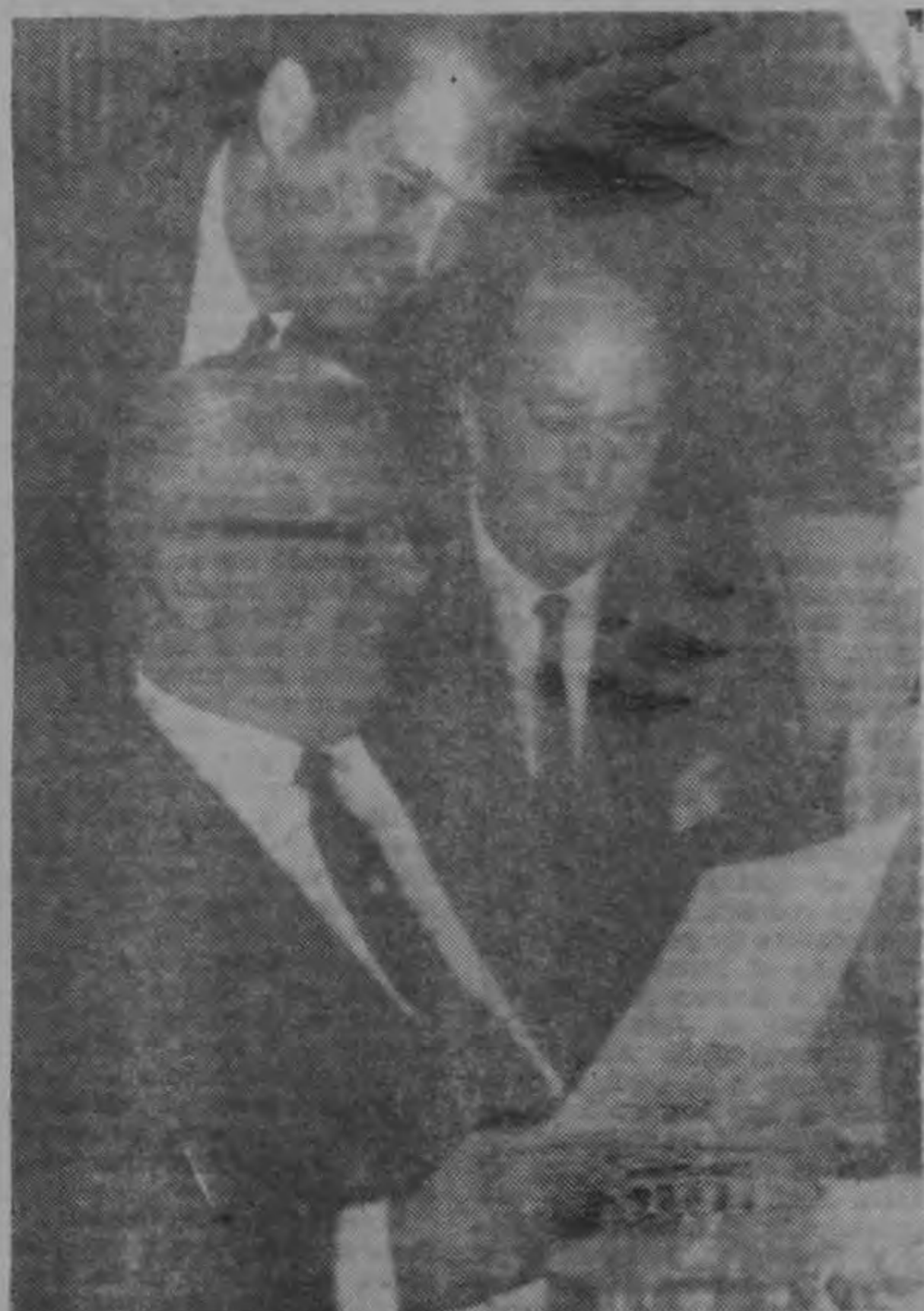
BUENOS AIRES, Feb. 21 (AP)— El Canciller de Brasil Juracy Magalhães (sentado) consulta un documento con sus colaboradores, Ministro Claudio Garcia de Souza (der) y embajador Pinheiro antes de la sesión de esta mañana en la Conferencia aquí 1967

BUENOS AIRES, 21 (AP)— Las repúblicas latinoamericanas aprobaron hoy por gran mayoría reducir sus gastos militares.