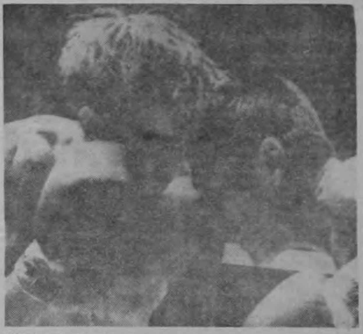
TOKIO, Feb. 21 (AP).—El campeón mundial de los Moscas, Horacio Accavallo, de la Argentina, izquierda, y el japonés Kiyoshi Tanobe chocan con las cabezas al cargar el uno contra el otro en el cuarto round de su combate en Tokio el lunes en el cual no estaba en juego el título. Accavallo perdió por nocaut técnico en el sexto asalto. 1967.