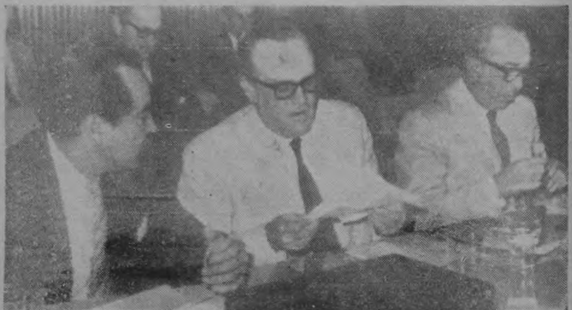
BUENOS AIRES, Feb. 21 (AP).— El Canciller de Venezuela Jorge Iribarren Borges (centro) consulta con su colega de Guatemala Emilio Arenales Catalán, mientras a la derecha el Canciller peruano

Los expertos consideran las de Rossini como los mejores ejemplos de grabación y color en existencia.